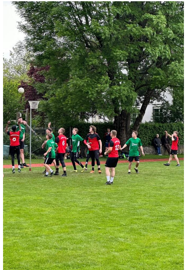
TV Hindelbank im Angriff gegen TV Madiswil

Hast auch du Lust Korbball zu spielen? Dann komme unverbindlich in ein Probetraining des TV Hindelbank.