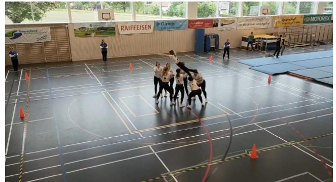
Spicker vor Anja ir Choreo