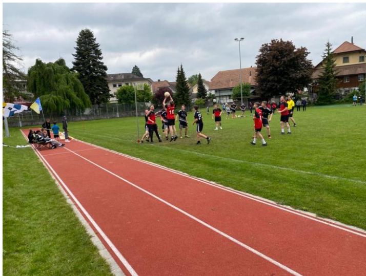
TV Hindelbank im Angriff

Im zweiten Spiel gegen den Turnverein Studen mussten sie sich durchkämpfen und am Schluss stand es 6 zu 6. Die zwei weiteren Spiele des TV Hindelbank gegen den TV Pieterlen und gegen den STV Roggwil konnten sie mit 5 zu 7 und 12 zu 6 wieder für sich entscheiden.