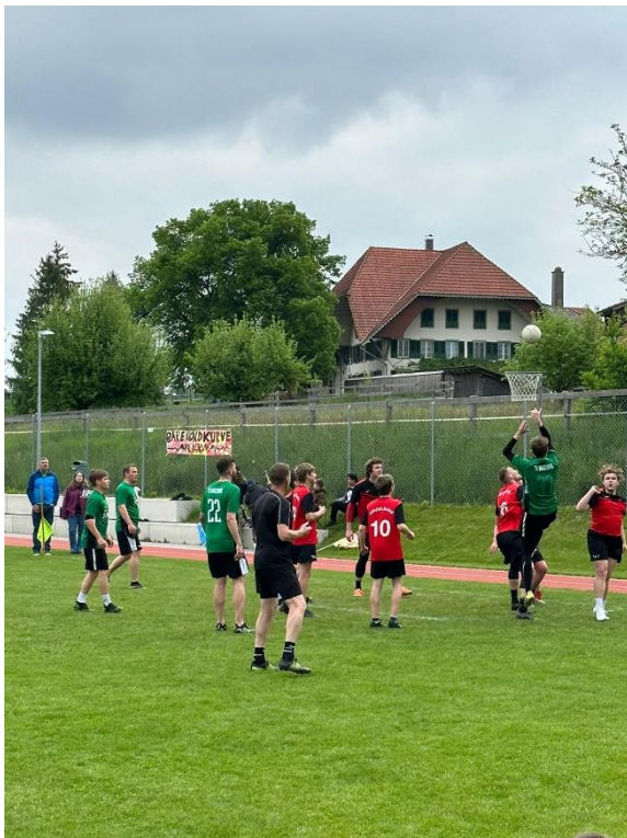
TV Hindelbank in der Verteidigung gegen TV Madiswil