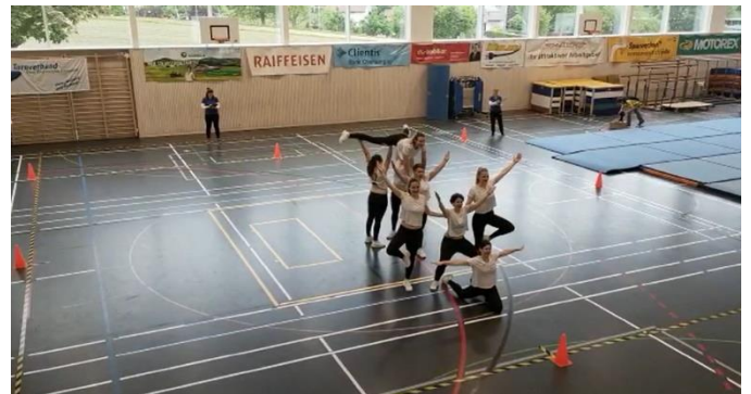
Schlussbiud vo üsärä Choreo

Motiviert si mir aber trotzdem gsi u hei u Fröid gha, üsi nöi mega cooli Choreo mit äm nöiä Tenü ds zeigä! 😊 Nachäm Uftritt ir Vorrundi am Vormittag si mir zfridä vom Platz, het ömu niämer ä Übertritt gmacht oder isch im fautschtä Eggä glandät, wüeu d'Formationä no nid so im Chopf gsi si. Mir hei bir Vorrundi meeega viu Zuäschouer gha, merci viumau, dass dir aui cho sit u üs agfürät heit! 😊