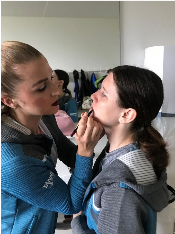
Ds obligatä Schminkä voräm Uftritt

Am Samschtig, 20. Mai 2023 hei mir (7 Turnerinnä) a dä Frühlingsmeisterschaftä im Verbandsturnä ds Roggu teilgno. Mir si scho chli närvös gsi, wüeu mir ersch grad si fertig wordä mit üsärä Choreo u dä Formationä u mirs drum no nid so viu hei chönnä dūrätürnä voräm Uftritt. Absägä isch aber nid i Frag cho u drum hei mir dä Uftritt aus Houptprob für ds Turnfescht u aus Wettkamftluft-Schnupperä agluägt.