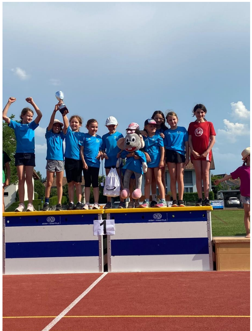
1. Platz Stafette Unterstufe der Mädchen