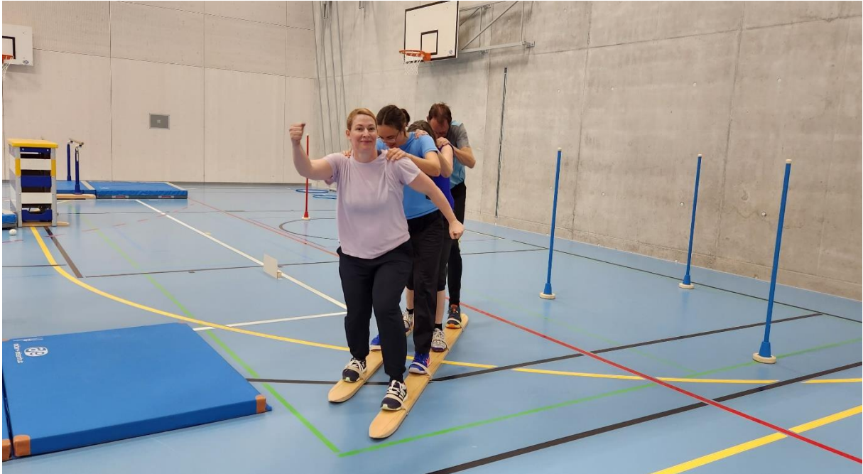
Voller Einsatz auf den Holzskiern

Bei dem legendären Posten der Kartonakrobatik mussten möglichst viele Kartonstücke zwischen definierten Körperteilen eingeklemmt werden. Je beweglicher die Teammitglieder waren, desto mehr Punkte konnten gesammelt werden. Die lustigen Positionen sorgten für viele Lacher. Die sieben Kampfrichter/innen sorgten dafür, dass alles fair und mit rechten Dingen zu und her ging.