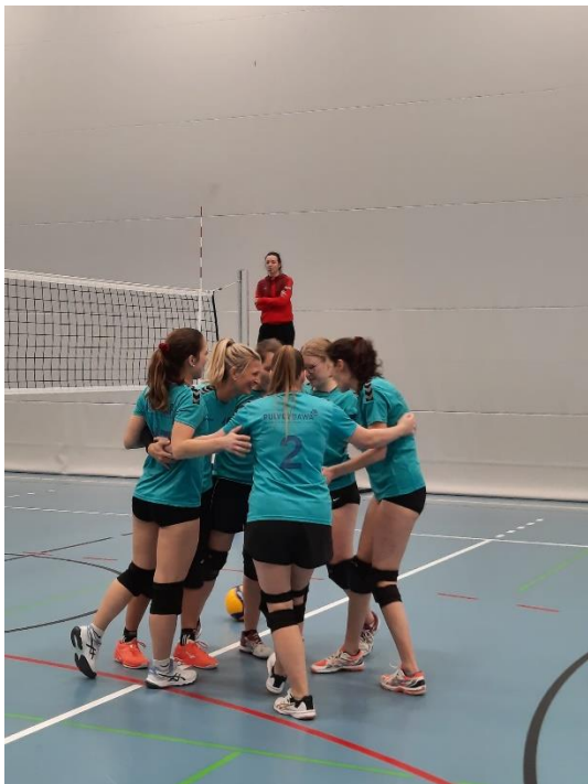
Die Hindelbankerinnen beglücken sich zu einem gelungenen Spielzug.

Die Volleyballerinnen des Turnvereins Hindelbank spielten letzten Donnerstag, den 26. Januar 2023 ab 20.15 Uhr zwei Matches der diesjährigen Meisterschaft 2022/2023 in Hindelbank. Die Motivation war entsprechend hoch, doch wurden sie am Ende nicht belohnt. Obwohl es zu Beginn noch gut aussah. So lagen sie nach fünf Minuten mit 10:6 in Führung gegen den TV Lotzwil. Die Hindelbankerinnen zeigen schöne Blocks und Abnahmen, sind jedoch in ihren Angriffen etwas zögerlich. Doch schaffen sie es, ihre Führung auf 19:15 auszubauen. Doch Lotzwil findet ins Spiel zurück und nutzt die Fehler der Gegnerinnen aus. So schafft Lotzwil es in der Schlussphase des ersten Satzes, das Spiel zu drehen und gewinnt diesen mit 22:25. Im zweiten Satz agierten die Hindelbankerinnen mutiger im Angriff. Dies wurde belohnt und sie gehen rasch in Führung. Lotzwil lässt aber nicht nach und bringt viele Bälle zurück. Der Satz dauert lange. Hindelbank schafft es diesen deutlich für sich zu entscheiden mit 25:17. Nun muss also der dritte Satz entscheiden. Dieser verläuft lange ausgeglichen. Beim Stand von 4:4 gelangen Lotzwil einige starke Anspiele, womit die Hindelbankerinnen Mühe bekunden. So schaffte es Lotzwil den dritten Satz mit 8:15 nach einer guten Stunde Gesamtspielzeit für sich zu entscheiden.