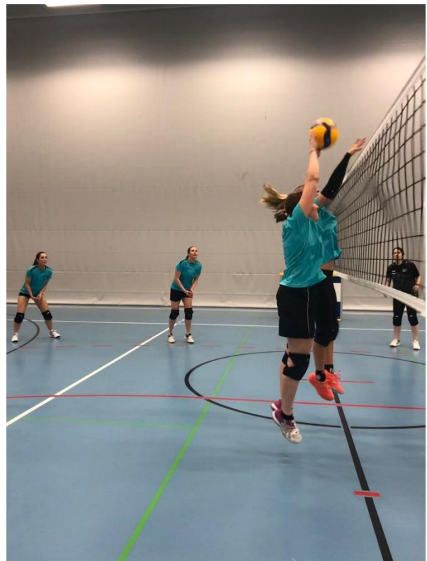
Hindelbank blockt einen Ball des TV Lotzwil

Das zweite Spiel des Abends verlief ohne Hindelbanker Beteiligung. In einem spannenden Match messen sich der TV Ursenbach und der STV Bleienbach. Die Mannschaften schenken sich nichts - so dauert das Spiel bis 22.30 Uhr. Am Ende gewinnt der TV Ursenbach mit 2:1 Sätzen (25:21, 24:16, 19:7).