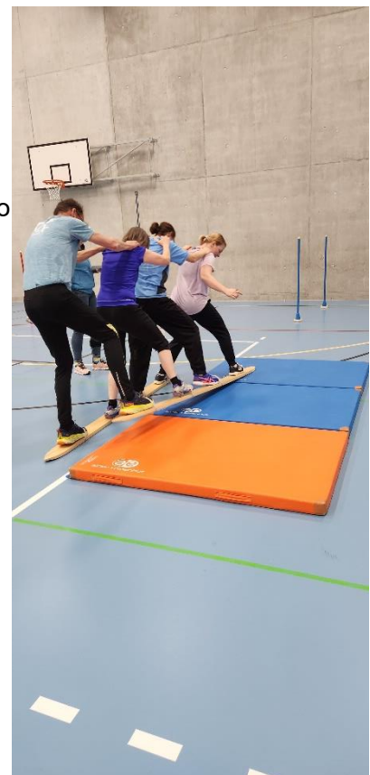
Koordination und Gleichschritt sind erforderlich, um mit den Skiern den Parcours zu meistern.