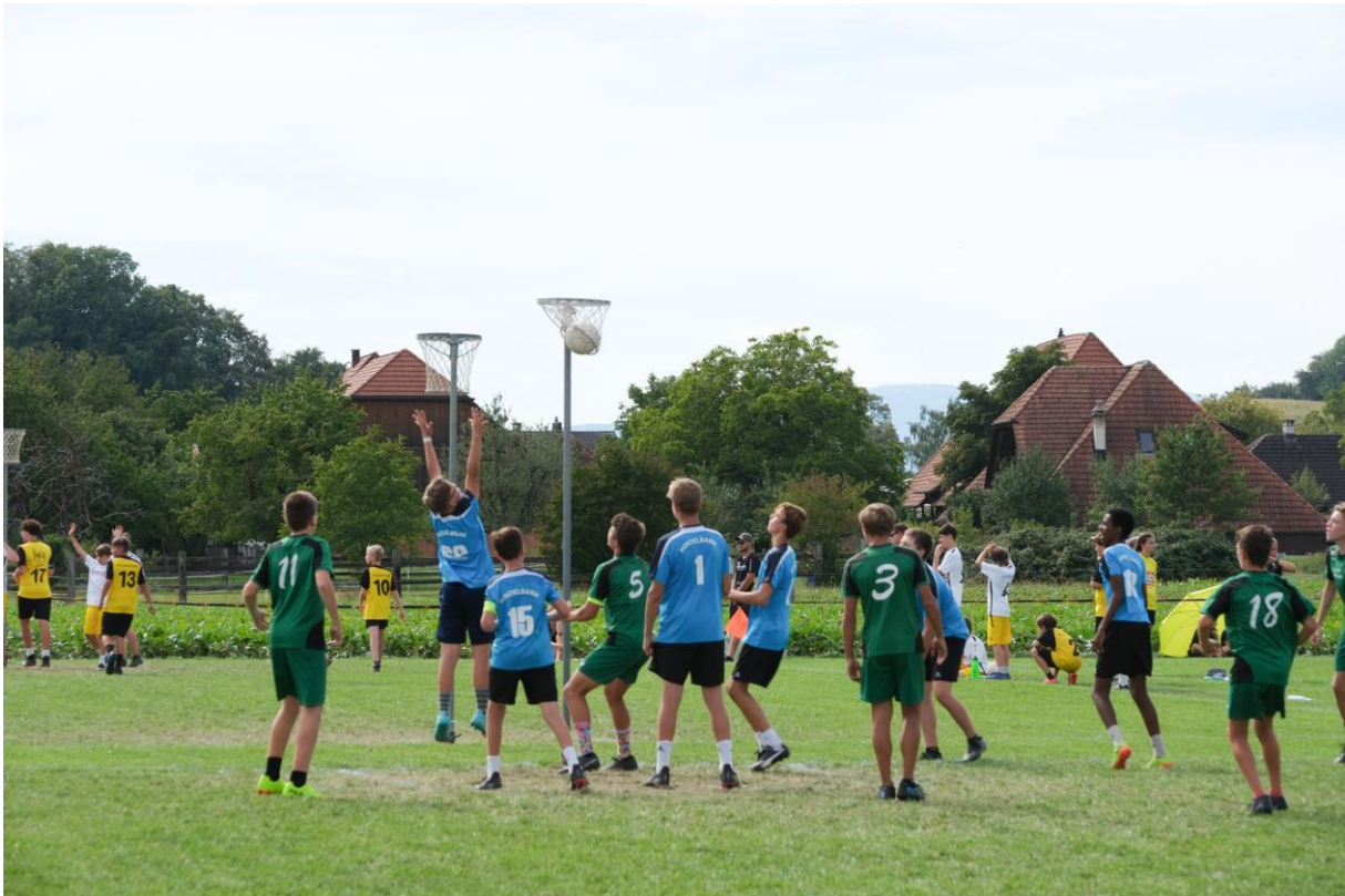
TV Hindelbank im Final gegen TV Madiswil

Im Finalspiel gegen Madiswil konnten sich die Hindelbanker Korbballjungs ziemlich deutlich mit 8:3 durchsetzen und sich nun U14-Knaben-Korbball-Schweizer Meister nennen.