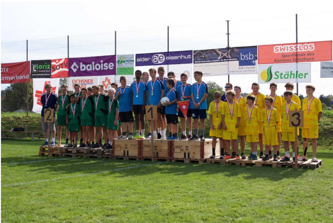
TV Hindelbank Podest auf dem 1. Rang

Herzliche Gratulation und hoffentlich weiterhin viele weitere schöne Titel.