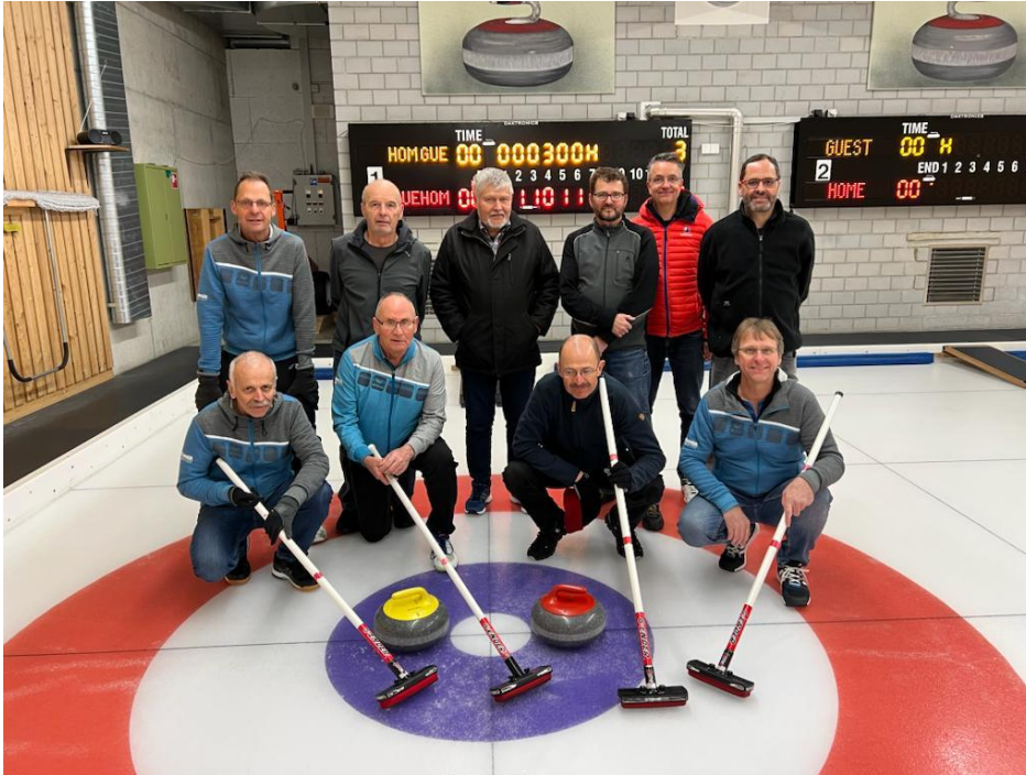
Immerhin konnten wir einen Sieger erküren!