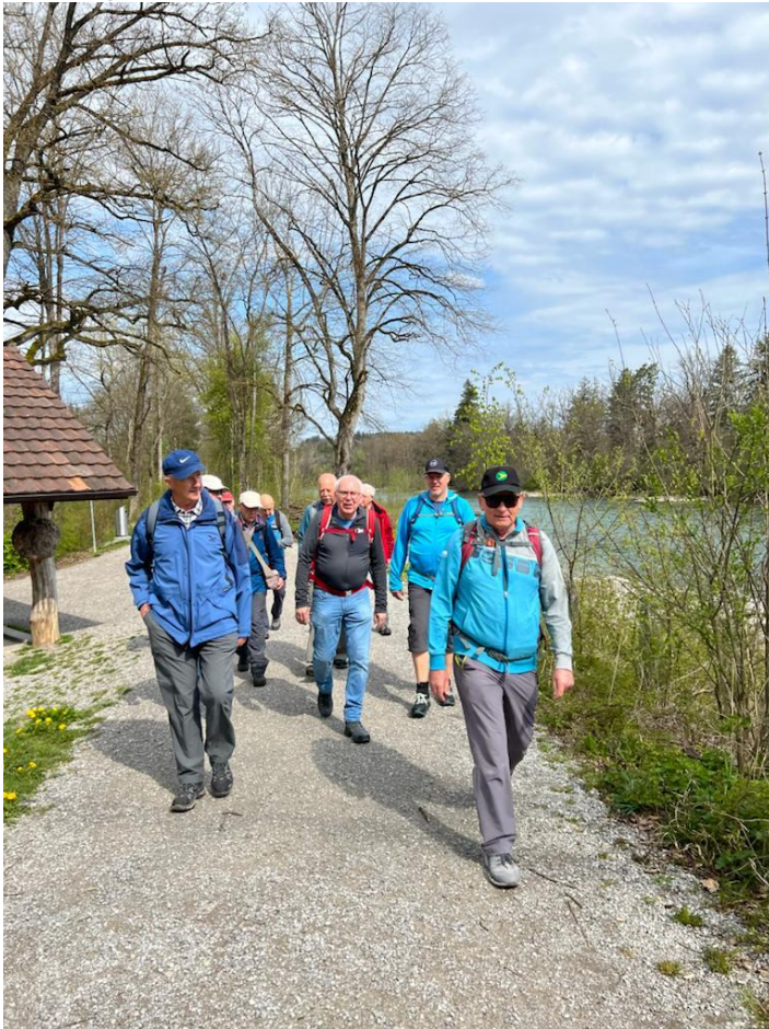
Die Frühjahrswanderer entlang der Aare