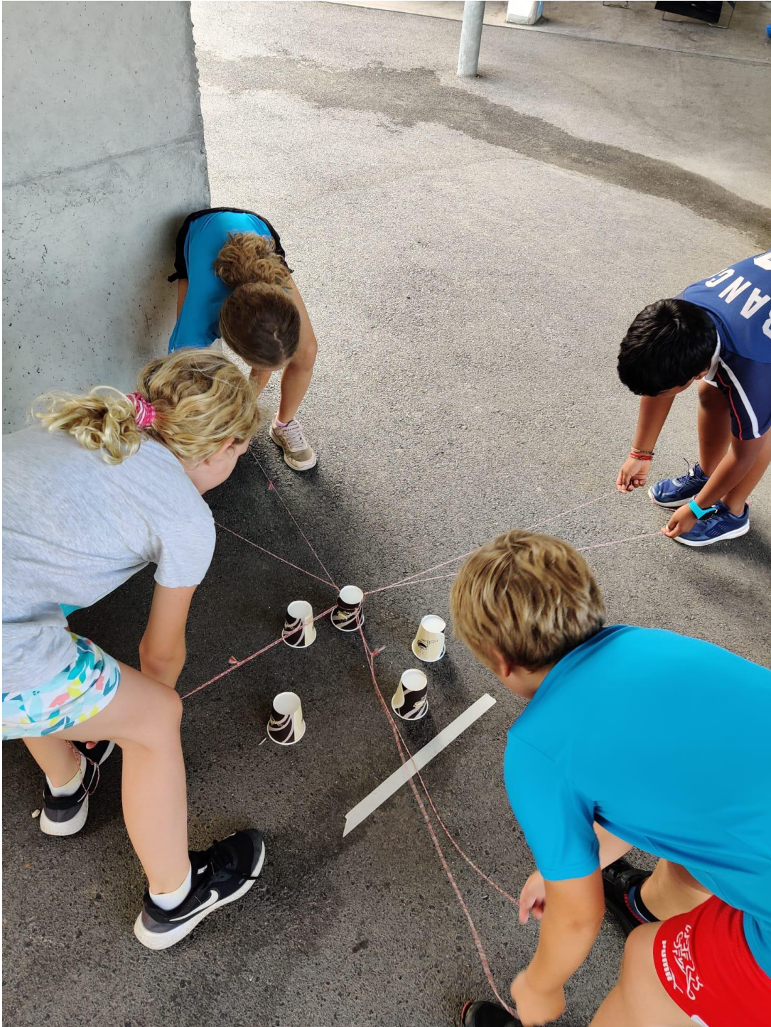
Posten Becher stapeln

Am Freitagabend trafen sich Kinder vom Kindergarten bis zur 9. Klasse zum Mosimann-Cup. Der Plauschwettkampf startete um 18.00 Uhr. Die Kinder absolvierten die 10 verschiedenen Posten, welche die Jugileitenden vorbereitet haben, voller Elan. Sei es nun beim Memory-Lauf, Knietransport, Becher-Stapeln, Zielschiessen mit der Nerf oder Kegeln – die Kinder waren mit Feuereifer dabei. Die Aufgaben wurden in durchmischten und zufälligen 4er-Gruppen absolviert.