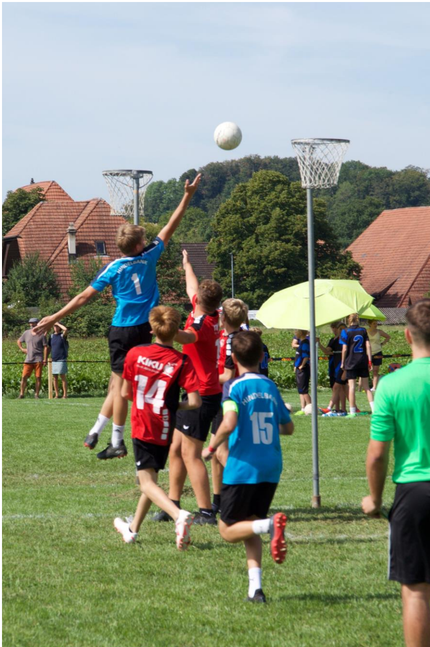
TV Hindelbank in der Vorrunde

Das Korbballteam aus Hindelbank startete mit einem Sieg gegen Erschwil in die Vorrunde der Schweizer Meisterschaft. Auch die restlichen Spiele der Vorrunde konnten sie problemlos gewinnen.