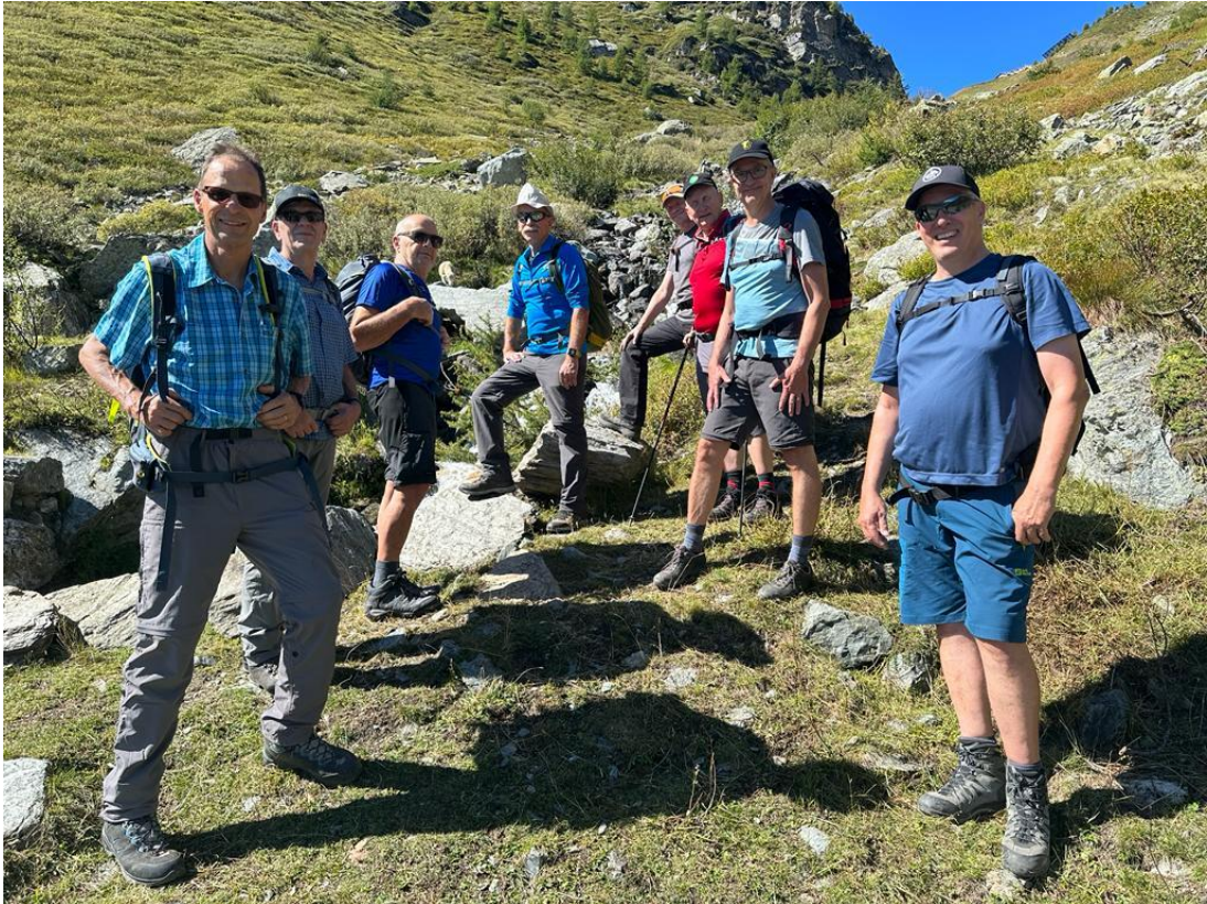
Riegenreise nach Törbel: Suche nach dem Reiseleiter