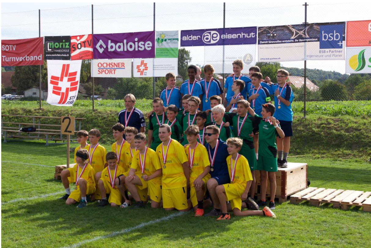
Gruppenfoto 1.-3. Rang U14