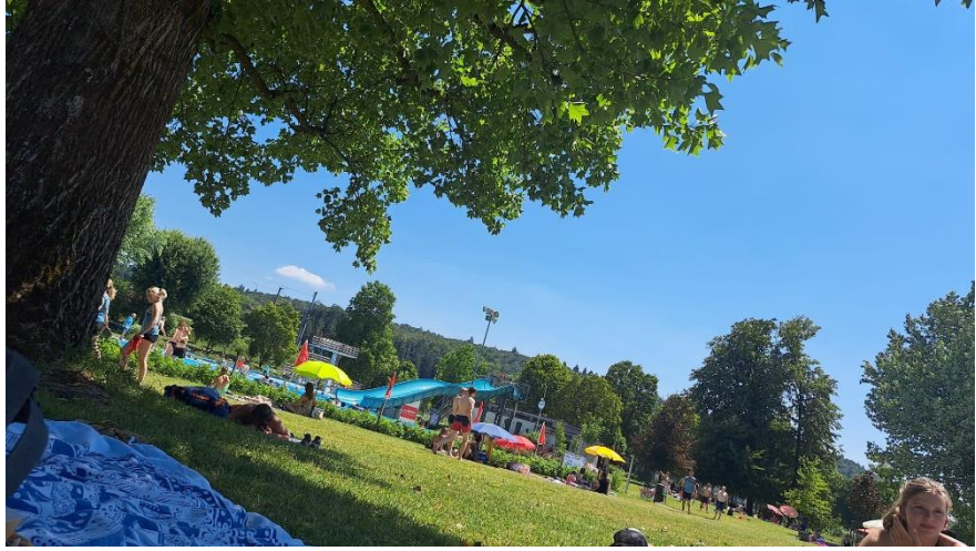
Abkühlung in der Badi nach dem Wettkampf