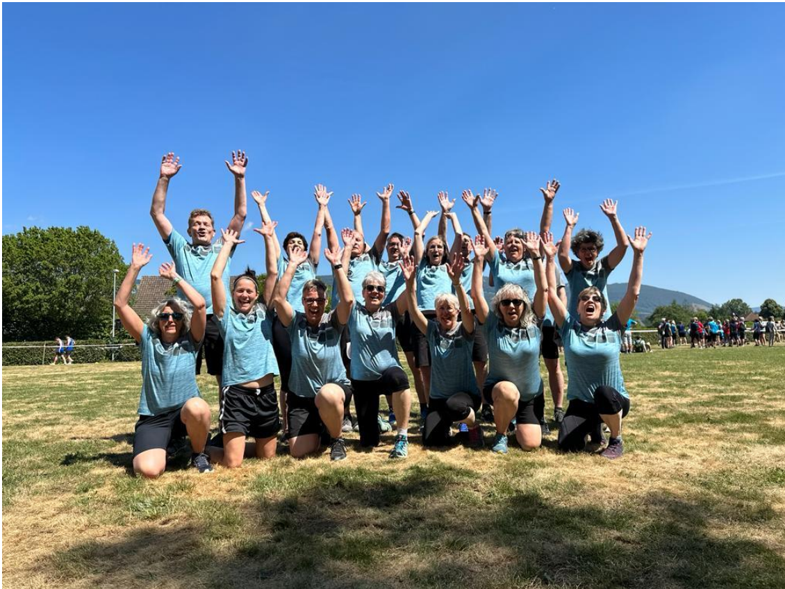
Grosse Freude bei den Turnfestsiegern

Da die Notengebung zum Vorjahr deutlich verschärft wurde, erreichten wir das Glanzresultat des Vorjahres nicht mehr. Immerhin haben wir sämtliche Gegner bezwungen – Bravo!