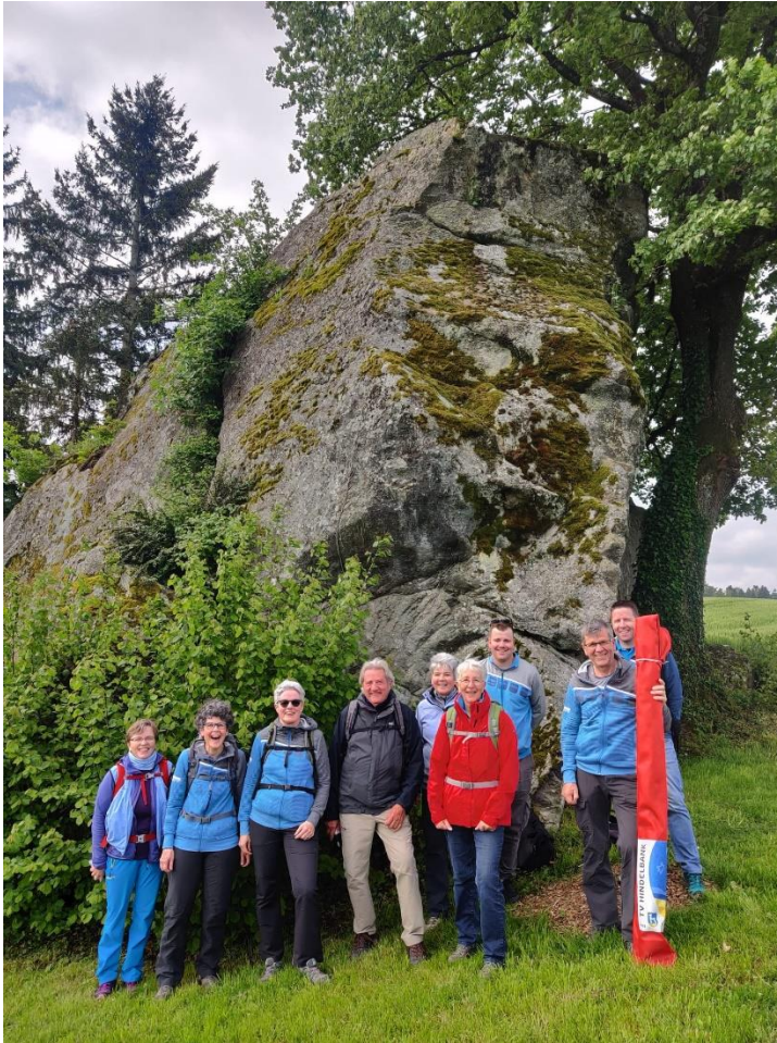
Die Auffahrts-Wanderer vor dem Findling im Steinhof Pech hatte der Fotograf mit den Radfahrern: Diese sind immer aus dem Bild gefahren!